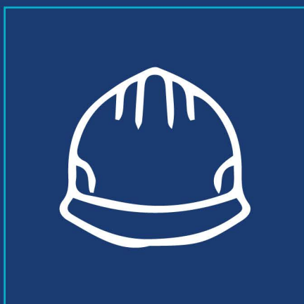
Gestión de Seguridad